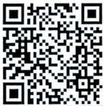
ГРАФИК ПЛАТЕЖЕЙ* к договору (контракту) от 18.01.2022 г. № 32

между O'ZBEKTELEKOM и РУз.Президенти Администрацияси хузурдаги Тиббиёт бош бошкармаси на общую сумму 372210,00