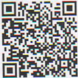
ГРАФИК ПЛАТЕЖЕЙ* к договору (контракту) от 24.01.2022 г. № 40124620/13

между O'ZBEKTELEKOM и Дехконобод туман СЭО ва ЖС хизмати на общую сумму 660000,00