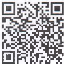
ГРАФИК ПЛАТЕЖЕЙ* к договору (контракту) от 27.01.2022 г. № 034/22

между ООО "Shayana farm" и Тиббий бирлашма на общую сумму 17 010 337,06