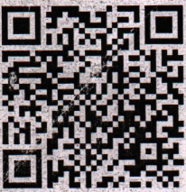
ГРАФИК ПЛАТЕЖЕЙ* к договору (контракту) от 20.01.2022 г. № 130031

между Оккургон Электр тармоклари и Туман тиббиет бирлашмаси на общую сумму 74999970,00