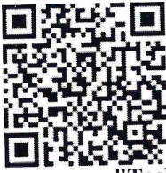
ГРАФИК ПЛАТЕЖЕЙ* к договору (контракту) от 05.01.2022 г. № 159/Б

между "Toshkent suv ta'minoti" MChJ Chirchiq shahar bo'limi и Тошкент вилояти Чирчик давлат педагогика институти на общую сумму 164997630,00