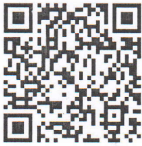
ГРАФИК ПЛАТЕЖЕЙ* к договору (контракту) от 24.01.2022 г. № 4

между O'ZBEKTELEKOM и Сайхунобод тумани Тиббиёт бирлашмаси на общую сумму 630000,00