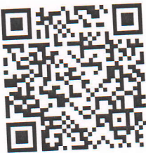
ГРАФИК ПЛАТЕЖЕЙ* к договору (контракту) от 26.01.2022 г. № 47

между "GULISTON GOLD TA'MINOT" и Вилоят Она ва бола скрининг маркази на общую сумму 496000,00