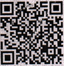
ГРАФИК ПЛАТЕЖЕЙ* к договору (контракту) от 20.01.2022 г. № 130031/8

между Оккургон Электр тармоклари и Туман тиббиет бирлашмаси на общую сумму 5400000,00