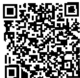
ГРАФИК ПЛАТЕЖЕЙ* к договору (контракту) от 25.01.2022 г. № 01/07-0131

между "HUBUDGAZTA'MINOT" AJ и Сардоба туман Тиббий бирланмасы на общую сумму 77998140,00