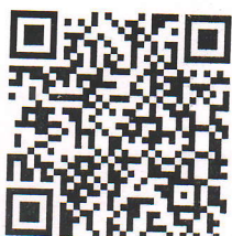
ГРАФИК ПЛАТЕЖЕЙ* к договору (контракту) от 10.01.2022 г. № 3442214

между O'ZBEKTELEKOM и Янгиер шаҳар Ижтимоий фанларни чуқур урганишга ихтисослаштирилган мактаб-интернати на общую сумму 300000,00