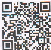
ГРАФИК ПЛАТЕЖЕЙ* к договору (контракту) от 28.01.2022 г. № 3/22

между ООО "ASIA PHARM LYUKS" и Сирдарё вилоят Фтизиатрия ва Пулмонология маркази на общую сумму 9997000,00