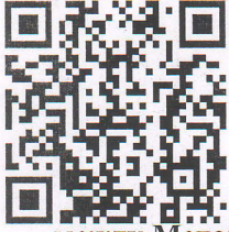
ГРАФИК ПЛАТЕЖЕЙ* к договору (контракту) от 07.01.2022 г. № 8

между Метан Янгир МЧЖ и Сирдарё вилоят Фтизиатрия ва Пульмонология маркази на общую сумму 2988000,00