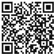
ГРАФИК ПЛАТЕЖЕЙ* к договору (контракту) от 07.01.2022 г. № 22К-77

между ООО Uzdigital TV и Ўз.Рес. Транспорт вазирлиги на общую сумму 1890000,00