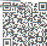
ГРАФИК ПЛАТЕЖЕЙ* к договору (контракту) от 18.01.2022 г. № А 37/22-01

между "NAMANGAN ISTIQLOL BOG'I" MCHJ и Учкургон туман тиббиёт бирлашмаси на общую сумму 8996400,00