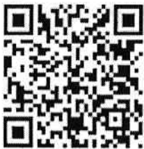
ГРАФИК ПЛАТЕЖЕЙ* к договору (контракту) от 27.01.2022 г. № 2

между "Чевар"МЧЖ и Наманган шахар МТБ Марказ на общую сумму 6078000,00