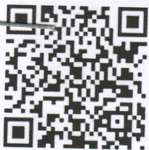
ГРАФИК ПЛАТЕЖЕЙ* к договору (контракту) от 20,01,2022 г № 38

между ОАЖ "Иссиклик манбаи" и Бухоро шаҳар 2-сон болалар-усмирлар спорт мактаби на общую сумму 5070120