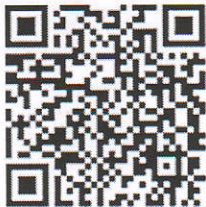
ГРАФИК ПЛАТЕЖЕЙ* к договору (контракту) от 28.01.2022 г. № 3438575

между O'ZBEKTELEKOM и Пахтакор туман хокимлиги на общую сумму 1500000,00