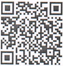
ГРАФИК ПЛАТЕЖЕЙ* к договору (контракту) от 13.01.2022 г. № 16/2-007

между "HUDUDGAZTA'MINOT" AJ и Тахиатош тумани Халк таълими булими (МБ) на общую сумму 3999600,00