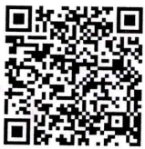
ГРАФИК ПЛАТЕЖЕЙ* к договору (контракту) от 05.01.2022 г. № 28-2022/IJRO

между ООО "UNICON-SOFT" и Эл-юрт умиди жамгармаси на общую сумму 1942800,00