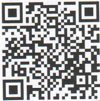
ГРАФИК ПЛАТЕЖЕЙ* к договору (контракту) от 05.01.2022 г. № 362-21

между Республика инкассация бирлашмаси и Тошкент вилояти тери-таносил касалликлари дипансери на общую сумму 12000000,00