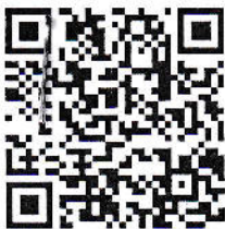
ГРАФИК ПЛАТЕЖЕЙ* к договору (контракту) от 28.01.2022 г. № 11 (КВП)

между Тоза худуд ДУК и Ширин шаҳар Тиббиёт бирлашмаси на общую сумму 1490400,00