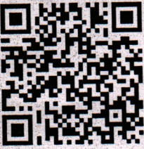
ГРАФИК ПЛАТЕЖЕЙ* к договору (контракту) от 28.01.2022 г. № 12-19/2

между "HUDUDGAZTA'MINOT" AJ и Туман тиббиет бирлашмаси на общую сумму 7499976,00