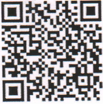
ГРАФИК ПЛАТЕЖЕЙ* к договору (контракту) от 21.01.2022 г. № 87

между O'ZBEKTELEKOM и Навоий вилояти Учқудук саноат техникуми на общую сумму 315000,00