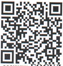
ГРАФИК ПЛАТЕЖЕЙ* к договору (контракту) от 28.01.2022 г. № 1/25

между ГОСУДАРСТВЕННОЕ УНИТАРНОЕ ПРЕДПРИЯТИЕ "TOZA-HUDUD" и И.В. Савицкий номидаги КР Давлат санъат музей на общую сумму 408200,00