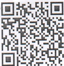
ГРАФИК ПЛАТЕЖЕЙ* к договору (контракту) от 12.01.2022 г. № 570081

между O'ZBEKTELEKOM и Тахиатош тумани Халк таълими бўлими (МБ) на общую сумму 270000,00