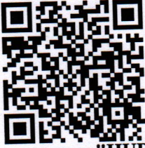
ГРАФИК ПЛАТЕЖЕЙ* к договору (контракту) от 29.01.2022 г. № 12-10/141

между "HUDUDGAZTA'MINOT" AJ и Угом Чоткол Давлат миллий табиат боги бошкармаси на общую сумму 4799520,00