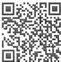
ГРАФИК ПЛАТЕЖЕЙ* к договору (контракту) от 24.01.2022 г. № 210101

между Кийи Чирчик Электр тармоклари и Ободонлаштириш бошкармаси на общую сумму 1499850,00