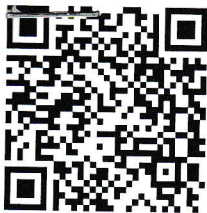
ГРАФИК ПЛАТЕЖЕЙ* к договору (контракту) от 18.01.2022 г. № 36/22

между O'ZBEKTELEKOM и Яккабоғ туман СЭО ва ЖС хизмати на общую сумму 540000,00