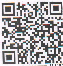
ГРАФИК ПЛАТЕЖЕЙ* к договору (контракту) от 28.01.2022 г. № TS-494

между "IT-MED" MCHJ и Сирдарё вилоят Фтизиатрия ва Пульмонология маркази на общую сумму 2040000,00