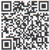
ГРАФИК ПЛАТЕЖЕЙ* к договору (контракту) от 30.01.2022 г. № 190473558

между О'ЗВЕКТЕЛЕКОМ и Янгийул шаҳар ахборот кутубхона маркази на общую сумму 720000,00