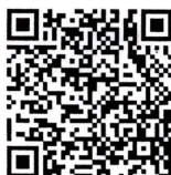
ГРАФИК ПЛАТЕЖЕЙ* к договору (контракту) от 05.01.2022 г. № 152-2022/ЕХАТ

между ООО "UNICON-SOFT" и Эл-юрт умиди жамгармаси на общую сумму 253300,00