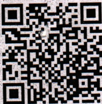
ГРАФИК ПЛАТЕЖЕЙ* к договору (контракту) от 28.01.2022 г. № 12-19/1

между "HUDUDGAZTA'MINOT" AJ и Туман тиббиет бирлашмаси на общую сумму 69999996,00