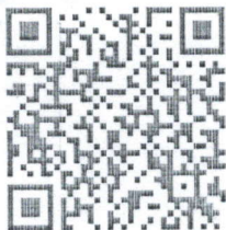
ГРАФИК ПЛАТЕЖЕЙ* к договору (контракту) от 20.01.2022 г. № 100110

между Мирзаобод тумани Электр тармоқлари корхонаси и Мирзаобод туман Санитария-эпидемиологик осойишталик ва жамоат саломатлиги хизмати на общую сумму 1499850,00