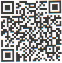
ГРАФИК ПЛАТЕЖЕЙ* к договору (контракту) от 31.01.2022 г. № 40425763

между O'ZBEKTELEKOM и Жанубий Мирзачул магистрал канали бошкармаси на общую сумму 720000,00