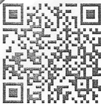
ГРАФИК ПЛАТЕЖЕЙ* к договору (контракту) от 05.01.2022 г. № 3151053

между O'ZBEKTELEKOM и Куйичирчик тумани ХТБ на общую сумму 207000,00