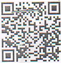
ГРАФИК ПЛАТЕЖЕЙ* к договору (контракту) от 27.01.2022 г. № 875

между "Наманган Дори Дармон " АЖ и Учкургон туман тиббиёт бирлашмаси на общую сумму