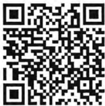
ГРАФИК ПЛАТЕЖЕЙ* к договору (контракту) от 28.01.2022 г. № 65-22/ПП

между O'ZBEKTELEKOM и Ўз.Рес. Транспорт вазирлиги на общую сумму 251784,00