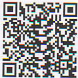
ГРАФИК ПЛАТЕЖЕЙ* к договору (контракту) от 21.01.2022 г. № 11702-2021/75-IJRO

между ООО "UNICON-SOFT" и Дехконобод туман СЭО ва ЖС хизмати на общую сумму 1457100,00