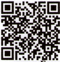
ГРАФИК ПЛАТЕЖЕЙ* к договору (контракту) от 24.01.2022 г. № 050611

между Гулистон туман Электр тармоклари корхонаси и Гулистон туман ирригация бўлими на общую сумму 1839600,00