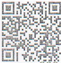
ГРАФИК ПЛАТЕЖЕЙ* к договору (контракту) от 25.01.2022 г. № 27

между ООО Ориё меҳр и У.Халмуратов номидаги Республика кўп тармокли тиббиёт маркази на общую сумму 18609700,00