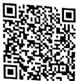
ГРАФИК ПЛАТЕЖЕЙ* к договору (контракту) от 12.01.2022 г. № 9/eq-125-2022

между ООО Единый интегратор UZINFOCOM и Мирзаобод туман Хокимияти на общую сумму 6000000,00