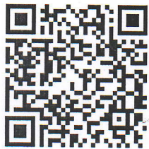
ГРАФИК ПЛАТЕЖЕЙ* к договору (контракту) от 19.01.2022 г. № 1510

между О'ЗВЕКТЕЛЕКОМ и И.В. Савицкий номидаги КР Давлат санъат музей на общую сумму 360000,00