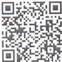
ГРАФИК ПЛАТЕЖЕЙ* к договору (контракту) от 19.01.2022 г. № 60

между "КО'К-ТЕРАК" МЧЖ и Тошкент тумани МТБ на общую сумму 8992500,00