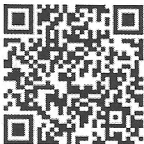
ГРАФИК ПЛАТЕЖЕЙ* к договору (контракту) от 17.01.2022 г. № 15

между Центр Госсанэпиднадзора и "CHIRCHIQ OLIMPIYA ZAXIRALARI KOLLEJI" на общую сумму 1500245,00