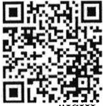
ГРАФИК ПЛАТЕЖЕЙ* к договору (контракту) от 25.01.2022 г. № 02

между "ISHLAB CHIGARISH TA'MINOT VAZA" MCHJ и Наманган шаҳар МТБ Марказ на общую сумму 25712000,00