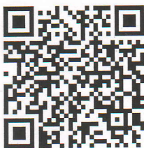
ГРАФИК ПЛАТЕЖЕЙ* к договору (контракту) от 31.01.2022 г. № 3438597

между О'ЗБЕКТЕЛЕКОМ и Жанубий Мирзачул магистрал канали бошкармаси на общую сумму 150000,00