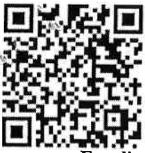
ГРАФИК ПЛАТЕЖЕЙ* к договору (контракту) от 26.01.2022 г. № 4

между Fayzli obod go'slit sut МЧЖ и Янги Наманган тумани мактабгача таълим бўлими Марказ на общую сумму 24000000,00