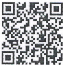
ГРАФИК ПЛАТЕЖЕЙ* к договору (контракту) от 02.02.2022 г. № 18

между IDEAL NUKUS ЖШЖ и Республикалык Каракалпак Лепрозорияси на общую сумму 3480000,00