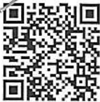
ГРАФИК ПЛАТЕЖЕЙ* к договору (контракту) от 26.01.2022 г. № 38

между Сайхунобод ТИФУК и Сирдарё вилояти Автомобил йуллари бош бошкармаси на общую сумму 352764000,00