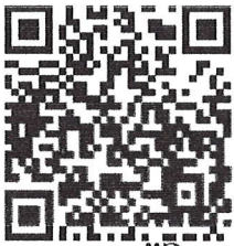
ГРАФИК ПЛАТЕЖЕЙ* к договору (контракту) от 05.01.2022 г. № С/М-19

между "Элликкальа йўллардан мунтазам фойдаланиш" УК и Коракалпогистон Республикаси худудий автомобиль йўллари Бош бошкармаси на общую сумму 84820000,00